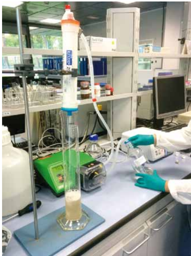
FIGURA 1. Elución del filtro Rexeed en los laboratorios de Aigües de Barcelona.

Aquavalens, se basan en técnicas de PCR (reacción en cadena de la polimerasa) y en la tecnología de hibridación in situ de fluorescencia (FISH): GPS ( http://www.geneticpcr.com ) y Ceeram ( http://www.biomerieux-industry.com/food/ceeramtools-virus-pcr-detection-kits ) produjeron kits qPCR, mientras que Vermicon ( https://www.vermicon.com/ ) produjo kits para la técnica de FISH.